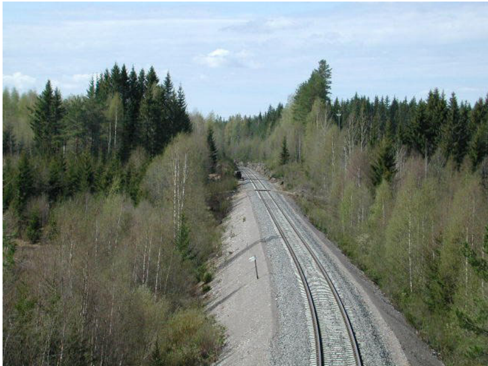
Kuva: Jouni Hytönen, Lehtolan tasoristeys