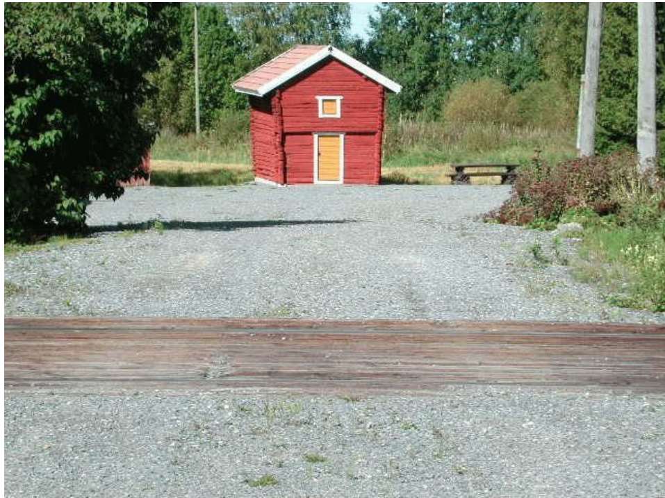
Kuva: Erkki Ritari, Perälän tasoristeys